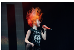
Hayley Williams, Paramore Rock im Park, Nürnberg 2013