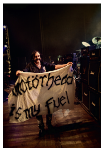
Pep Bonet Mötörhead South American Tour, 2010 aus der Serie »Röadkill – Motörhead«