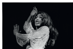
Barbara Klemm Tina Turner, Frankfurt, 1971