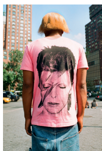
Susan Barnett Pink David Bowie, 2015 aus der Serie »Not in your Face«