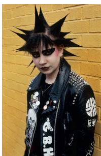
Derek Ridgers Shelley, Chelsea, 1982